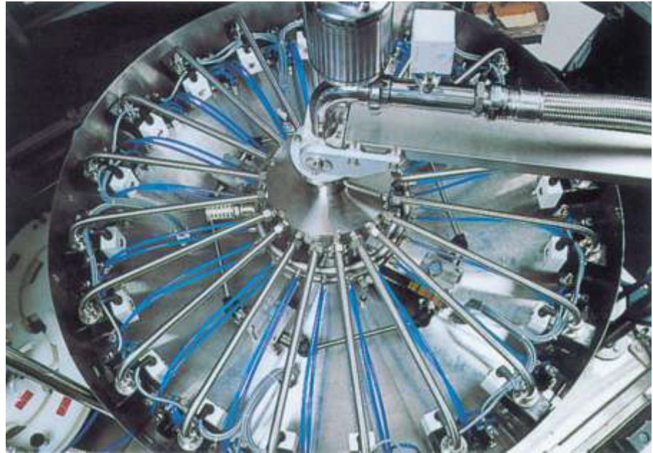
Máquina dosificadora con 18 MID, DN 15 que trabaja con la unidad electrónica con una resolución de 28,3 impulsos/min.

Todas las tarjetas están equipadas con tarjetas de bornas, serie QB, para facilitar la conexión a medidores, válvulas y electrónica externa.