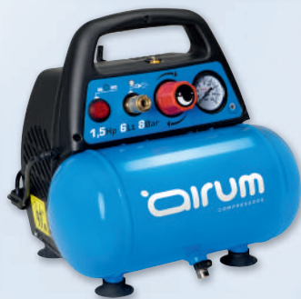
NEW VENTO OL195 AIRUM

1.5 hp caldera 6 lts. 180 lts./min. 220V II 8 bar.