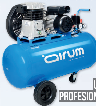
B2800B/50 CM3 AIRUM

3 hp caldera 50 lts. 330 lts./min. 220V II 9 bar.