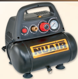
NEW VENTO 200/8/6 NUAIR

1.5 hp caldera 6 lts. 180 lts./min. 8 bar. Sin aceite.