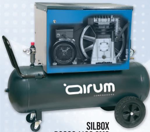
SILBOX B3800/100 CM3 AIRUM

3 hp caldera 100 lts. 390 lts./min. 220V II 10 bar. 69 dB(A).