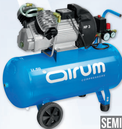
VDC/50 CM3 AIRUM

3 hp caldera 50 lts. 320 lts./min. 230V II 9 bar.