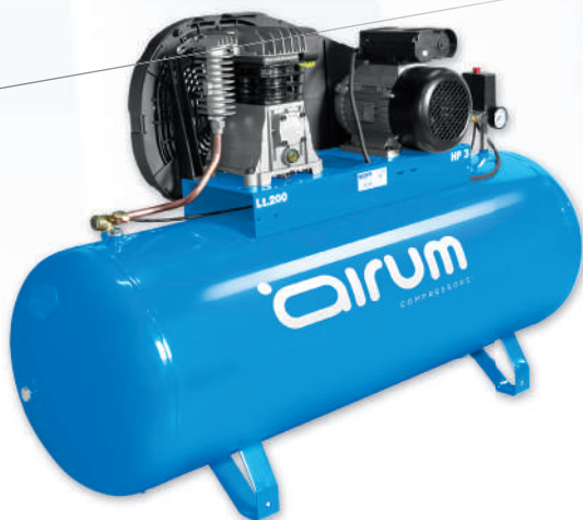
B2800B/200 FM3 AIRUM

3 hp caldera 200 lts. 330 lts./min. 220V II 9 bar.