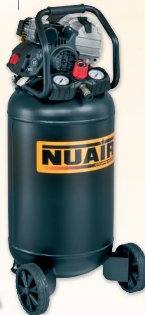
FUTURA 227/10/30V NUAIR

2 hp caldera 30 lts. 222 lts./min. 10 bar máx.