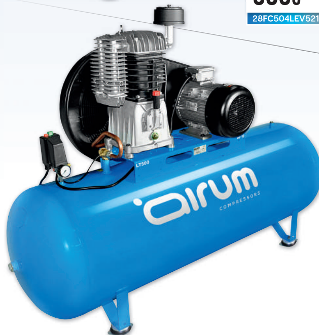
NB4/270 FT 5.5 AIRUM

5.5 hp caldera 270 lts. 550 lts./min. 400V III 11 bar.