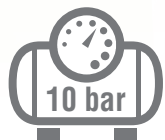
B2800B/3M/50 TECH NUAIR

3 hp caldera 50 lts. 330 lts./ min. 10 bar máx. Monofásico.