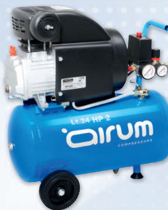
RC2/24 CM2 AIRUM

2 hp caldera 24 lts. 220 lts./min. 220V II 8 bar.