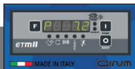
Controlador electrónico ETMII

Instalado sobre los modelos Compact de 10 hp y DBS hasta 15 hp.