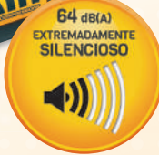
SIL-AIR 244/6 NUAIR

1.5 hp caldera 6 lts. 130 lts./min. 64dB(A), 8 bar. Sin aceite.