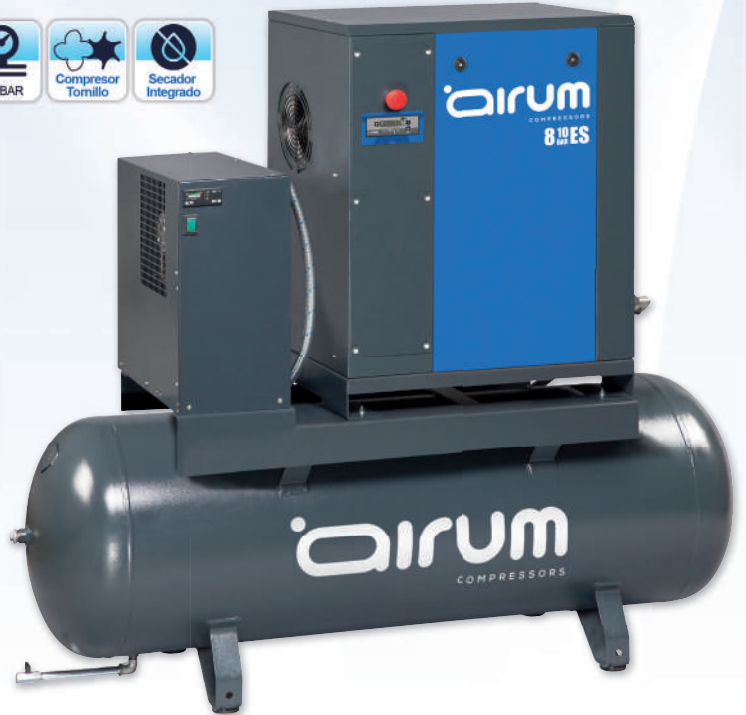
DBS 7.5-10-500 ES AIRUM

10 hp caldera 500 lts. 1000 lts./min. 400V III 10 bar. 68 dB(A).