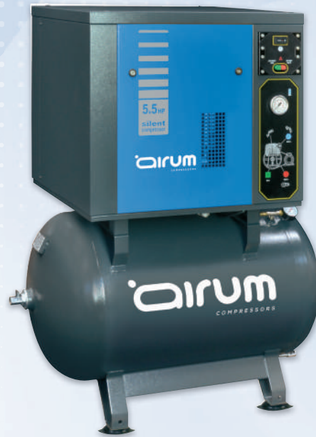
SILBOX NS5/270 FT 5.5 AIRUM

5.5 hp caldera 270 lts. 640 lts./min. 400V III 11 bar. 70 dB(A).