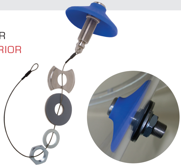
Componentes del kit Se muestra con la herramienta de instalación